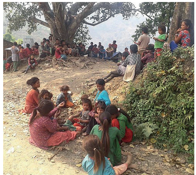
CHEPANG zijn een van de lagere tribale en geïsoleerde groep in zuid Nepal