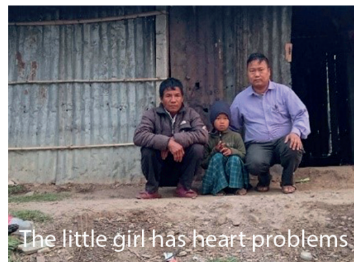
The little girl has heart problems