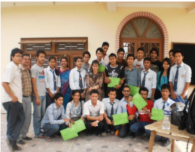
En later..... de Nepalese studenten met hun certificaat na de voorlichtingscursus over bekkenproblematiek en drama.

. Overall langs de weg zitten de mensen gehurkt hun werk te doen; wassen, water halen, hout verzamelen, koken, akkers bewerken noem maar op. Het is back to basics. Vrouwen lopen langs de weg met werkelijk gigantische korven met hout/stro/bladeren/gras etc. op hun rug, die met een band over het voorhoofd gedragen worden. Over ergonomische werkhouding gesproken. Maar helaas hebben de mensen op het land weinig keuze. De bus werd voller en voller, proppen maar, ellebogen, geplette tenen, noem maar op. Ik heb zelfs een bus gezien waar twee geiten bovenop de bus vastgebonden stonden!