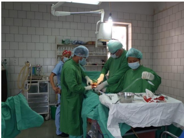
Het team aan het werk!